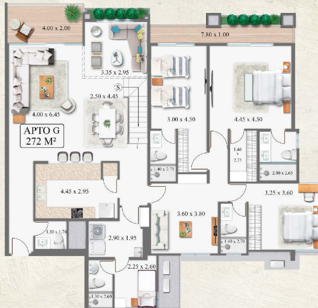
Nivel 300 - 272m² - Apto G Level 300 - 2927,78 - Apt G